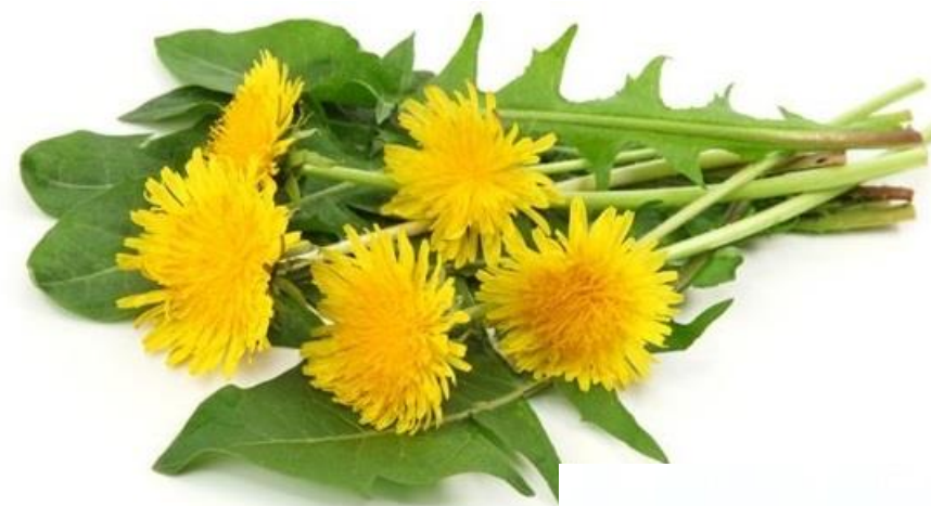
Pampeliška - listy