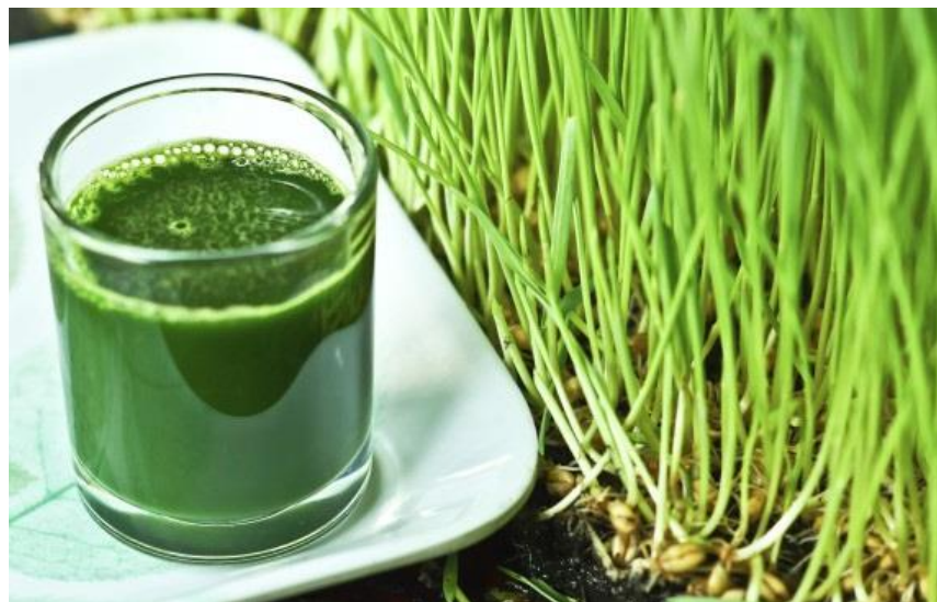
Mladé obilí (pšenice)

Obilí si můžete pěstovat sami doma v misce, pak ostříhat nůžkami a odšťavit.