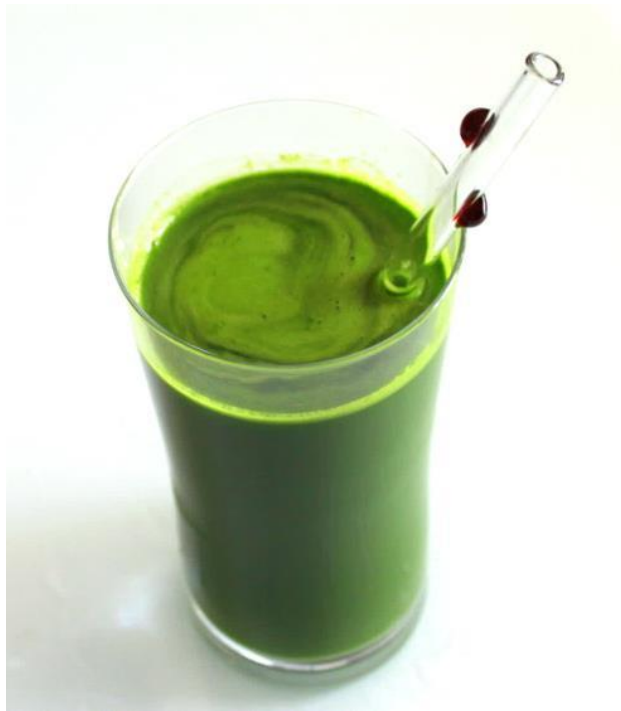
Hořčice - listy