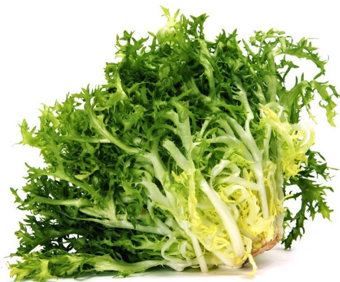
Endivie / šterbák